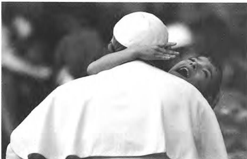
Pope Francis embraces a young boy with cerebral palsy on Easter Sunday