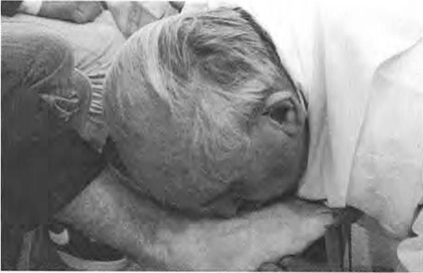
Pope Francis washes the kisses the feet of youth on prison visit Holy Thursday