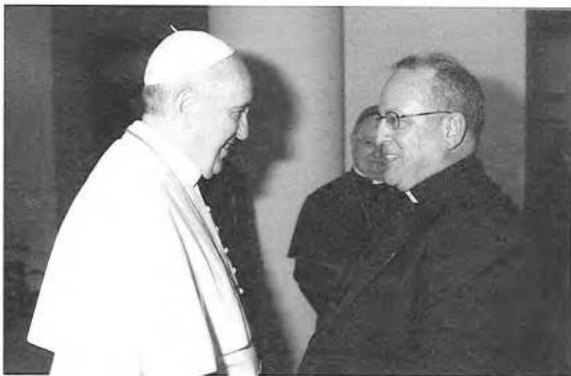
El Papa Francisco saluda al P. Gregory Gay después de la Misa en Casa Santa Marta el 16 de abril