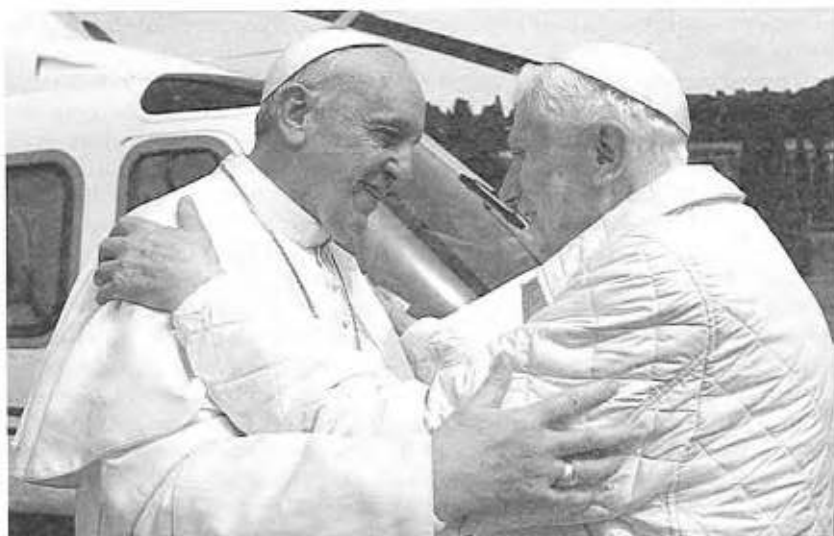
Papa Francisco, saluda a Papa Emérito Benedicto XVI en Castelgandolfo el 23 de marzo de 2013