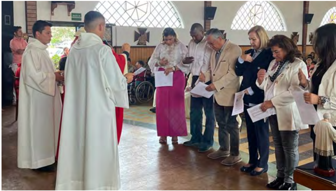
FUNZA - VILLA PAÚL