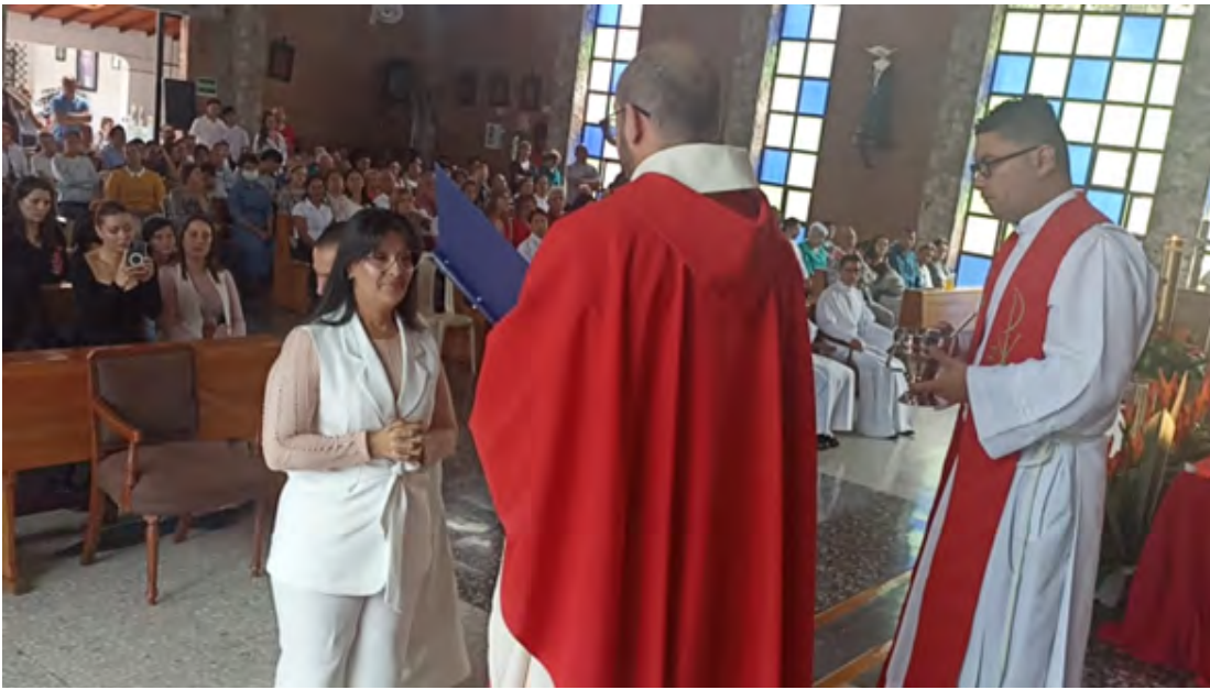
MEDELLÍN - SEPAVI