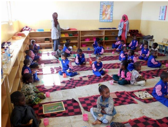
Niños de Kindergarten en la nueva guardería

La nueva guardería Amanecer de Esperanza incluye cuatro edificios que ascienden a 1.315 metros cuadrados de espacio, situado en un complejo con verja de 4.200 metros cuadrados con zonas de juegos. Un edificio tiene tres oficinas, una clínica, biblioteca, y aseos. Un segundo y un tercero edificio, que tienen el mismo plan de planta, tiene cada uno cuatro clases y bloques de aseos. El edificio más amplio tiene una cocina, comedor, sala de reposo para kindergarten, y habitación de mantenimiento. La guardería Amanecer de Esperanza tiene capacidad para servir a 250 niños de edad de kindergarten y 80 estudiantes de escuela primaria, la mayoría de los cuales vienen de familias Negede Woyito.