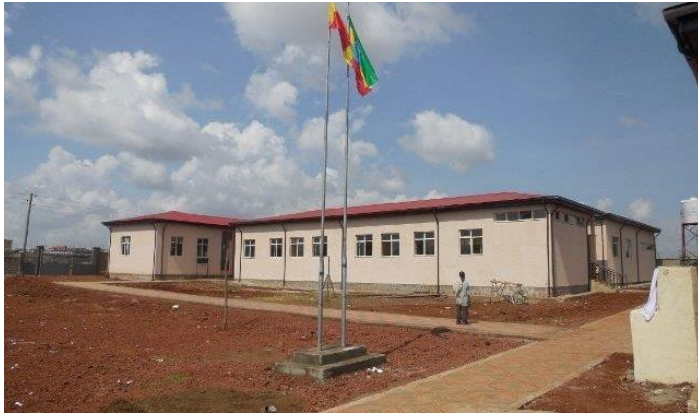
La guardería Amanecer de Esperanza

estudiantes en la Escuela Secundaria Vandenberg en los Estados Unidos para ayudar a comprar equipo para campos de juego para el nuevo centro.