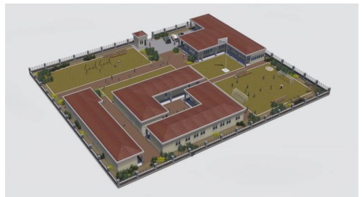
Plan de sitio para la guardería Amanecer de Esperanza