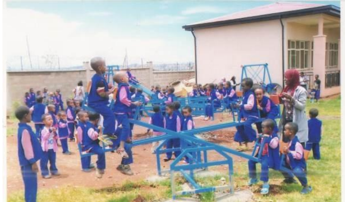
Niños en los campos de juego de la guardería

Parte del espacio administrativo de la guardería Amanecer de Esperanza se utiliza para coordinar un programa de micro-crédito. Este programa promueve empresas en casas de campo entre las mujeres Negede Woyito tales como costura, venta de ropa y la cría de animales de granja.