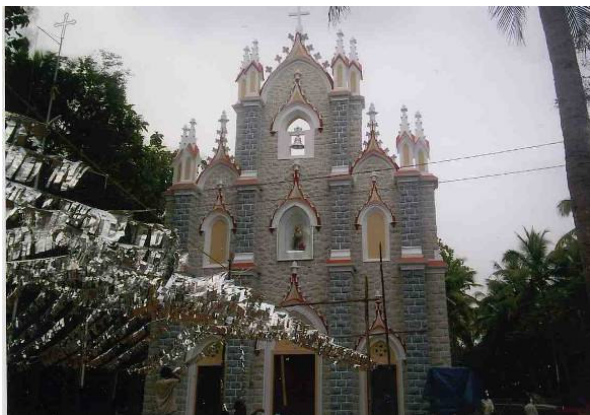
Iglesia de San José, en Koithoorkonam

Hace poco la Archidiócesis de Trivandrum confió la Iglesia de San José, una parroquia de Koithoorkonam (Estado de Kerala, India) a nuestros cohermanos de la Provincia de India Sur. La parroquia está formada por 260 familias y 5 centros misioneros. Muchos parroquianos sufren pobreza y desempleo.