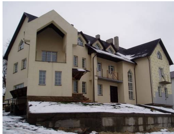
Regalo de Dios a punto de terminar el edificio en Kiev

La Viceprovincia de Santos Cirilo y Metodio fue erigida recientemente en 2001. Uno de los grandes desafíos para la nueva Viceprovincia fue la construcción de una Casa central de la comunidad. La casa se llamaría "Regalo de Dios", localizada en Kiev en Ucrania, y tendría varias funciones. Sería un lugar para encuentros para los miembros de la Viceprovincia, quienes sirven en áreas amplias de Ucrania, Bielorrusia y Rusia. Alojaría a seminaristas y a sus directores. Tendría una capilla que sería erigida como una Iglesia Católica Romana en Kiev. Y tendría una sala socio-parroquial para facilitar la ayuda a los pobres.