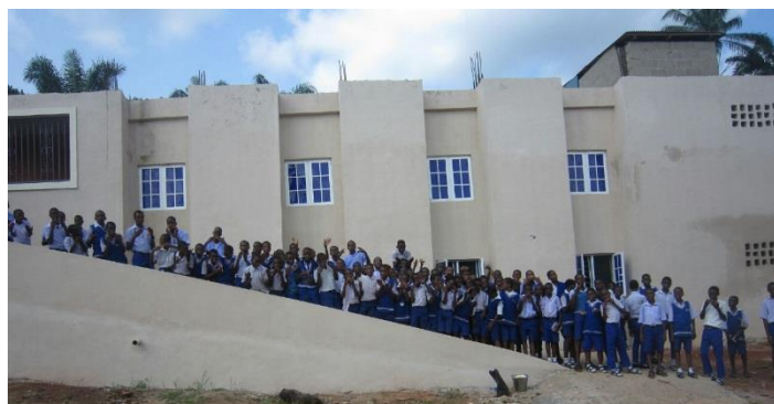
La nouvelle auberge de l'école et ses élèves

Beaucoup d'enfants à San Jose et De Paul vivent loin et ont besoin de rester dans les écoles. Nos confrères dans Oraifite ont décidé d'intégrer davantage les élèves ayant une déficience qui n'en possèdent pas, en les invitant à vivre ensemble. Ils ont besoin construire un nouvel abri pour être en mesure de le faire.