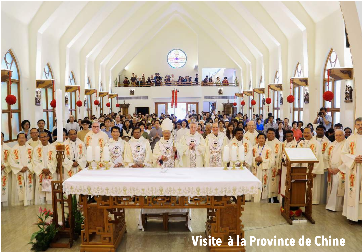
Visite à la Province de Chine