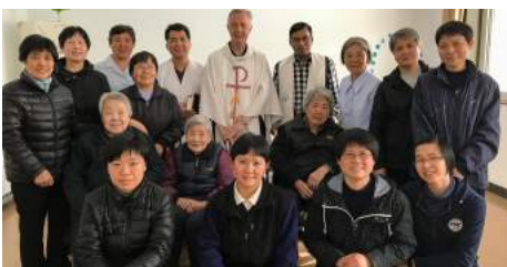
Visite canonique du Supérieur Général à la Province de Chine Pag. 02