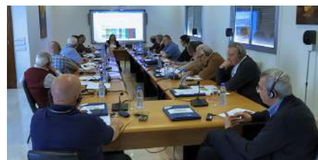
Assemblée annuelle de la CEVIM à Beyrouth (Liban) Pag. 04