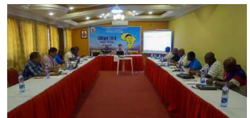
COVIAM: Conférence des visiteurs d'Afrique – Madagascar Pag. 05

Les points essentiels de la réunion de l'APVC Pag. 06