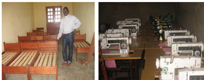
De nouveaux lits et des machines à coudre pour le centre

Nos confrères de la Mission de la République centrafricaine – Mission régionale du Cameroun – font face également à des défis socio-économiques dans leur travail. L'espérance de vie dans la République centrafricaine est de 49 ans ; la moyenne des années d'étude pour les adultes est de 3.5. Les inégalités sont profondes en République centrafricaine : les femmes et les enfants sont souvent victimes du travail forcé et du trafic humain.