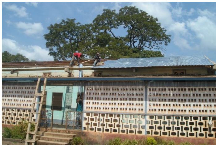
Les rénovations en cours à la résidence de la Mission

Nos confrères ont été confrontés à plusieurs nécessités de base lorsqu'ils sont arrivés à la paroisse. Les besoins les plus pressants étaient de trouver un moyen de transport pour visiter les 18 communautés, et de réparer de toute urgence leur résidence délabrée et presque inhabitable.