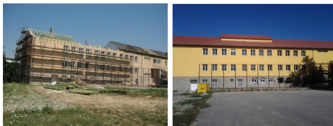
St László avant et après les renovations

Catholique en Hongrie pour l'intégration des étudiants présentant des difficultés d'apprentissage dans des classes régulières. La Province a acquis l'école du gouvernement hongrois. Le bâtiment a eu besoin de rénovation pendant quelque temps. Elle est devenue aussi trop petite pour accueillir le nombre croissant des effectifs.