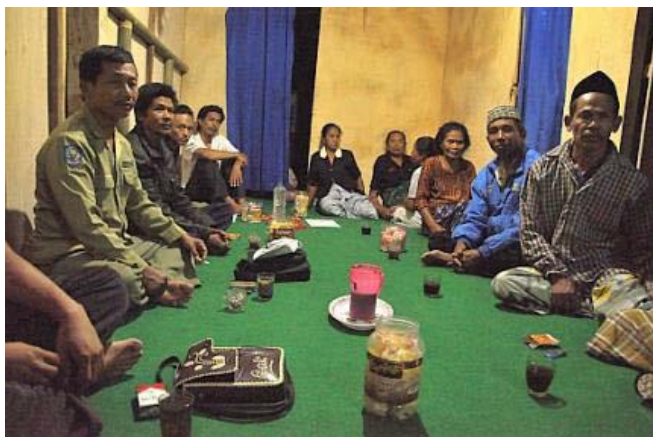
Réunion des cultivateurs pour la formation et l'organisation

Dans beaucoup de régions d'Indonésie les ouvriers agricoles souffrent de bas salaires, des conditions de vie pauvre, du manque d'éducation pour leurs enfants et des droits limités de se réunir et parler. Nos confrères indonésiens ont fait beaucoup pour former et organiser des travailleurs dans la Province de l'Est de Java pendant quelque temps, visant de vastes terres agricoles et non justifiées. Les confrères apprennent aux travailleurs en difficulté leurs droits selon la législation indonésienne et développent des leaders et des groupes cohésifs pour préconiser de meilleures conditions de travail et une rémunération juste.