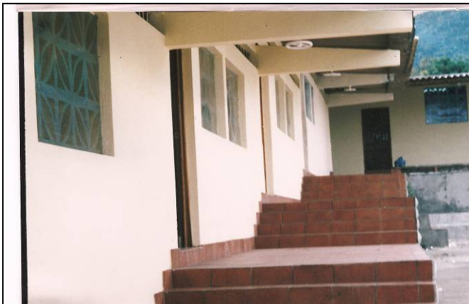
Maison de Retraite du Père Antonio Comte restaurée

L'histoire moderne du Salvador est marquée par la violence et l'instabilité économique. Les conditions socio-politiques du pays continuent de poser un défi. La guerre civile au Salvador, qui s'est terminée en 1992, avait forcé nos confrères à abandonner leur maison de mission dans la ville d'Alegría. Cette maison, établie en 1906, s'est grandement détériorée durant le temps qu'elle est restée inoccupée. Il y a quelques années, les confrères de la Province de l'Amérique Centrale ont commencé à rénover la maison d'Alegría pour la convertir en centre de retraite et d'évangélisation, d'action sociale, d'alphabétisation et de formation en agriculture. La Province de l'Amérique Centrale a fait une demande au VSO afin d'obtenir un octroi VSF pour un micro-projet d'amélioration de la maison. Le VSO a accordé l'octroi et la Province a pu entièrement restaurer la maison, appelée maintenant Maison de Retraite du Père Antonio Comte.