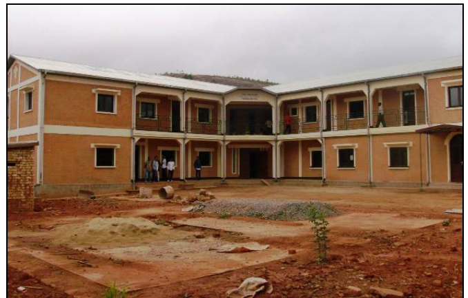
La nouvelle école apostolique à Fianarantsoa

Pendant plusieurs années, la Province de Madagascar n'avait aucune résidence pour les séminaristes qui terminaient leur second stage de formation religieuse, i.e. le cours d'apostolat de trois ans. Cette situation empêchait les candidats des zones rurales de Madagascar de participer pleinement au programme de formation de la Province, étant donné qu'ils ne pouvaient accéder adéquatement au cours secondaire. En conséquence, ils ne possédaient pas les compétences académiques requises qui les prépareraient aux exigences rigoureuses du grand séminaire. Pour cette raison, la Province de Madagascar a obtenu en 2004 une résidence temporaire permettant aux séminaristes de suivre des cours pré-universitaires dans une école catholique à Fianarantsoa. Les étudiants pouvaient ainsi suivre des cours en arts et sciences qui les préparaient à leurs études philosophiques et théologiques.