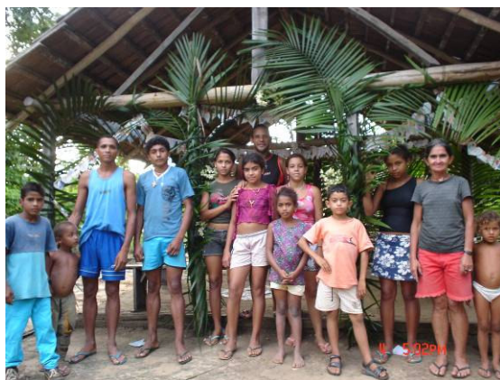
Catéchistes dans un village de la mission d'Itaituba

quelques autres, moins privilégiés, font l'expérience des routes pauvres et détériorées par les pluies fréquentes. Le Père Arno a donc élaboré un programme de formation à l'intention des responsables laïcs de catéchèse pour ces villages. À ce projet s'est ajouté un programme alimentaire en vue de remédier au problème de la malnutrition qui touche les enfants de ces villages. La Province a cherché de l'aide auprès de VSO pour financer le matériel didactique, les bibles, la nourriture et le transport pour la formation en leadership, ainsi que du bétail pour ce qui concerne le programme alimentaire. Le VSO, ayant obtenu des dons privés, y compris des contributions apportées par des confrères de Eastern Province des États-Unis, complétés par l'argent reçu du VSF, a pu financer la formation des responsables catéchistes et les programmes alimentaires.