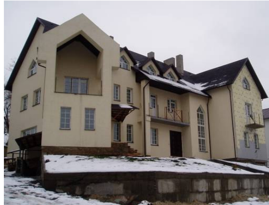
Cadeau de Dieu presque complètement à Kiev

Kiev et cette maison serait une paroisse/centre social pour faciliter l'assistance aux pauvres.