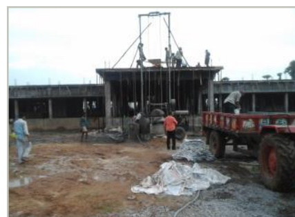
Construction du rez-de-chaussée de l'école, 2017. L'entrepreneur MG Narayana Rao supervise les travaux.