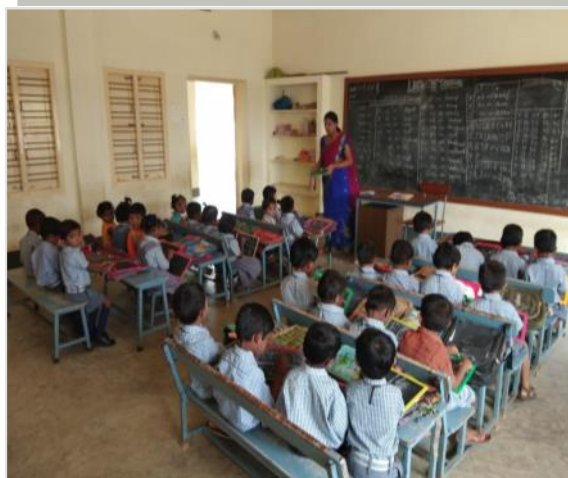
Classe et enseignant de la maternelle, 2019

années de développement, les missionnaires vincentiens ont mis à profit chaque partie du bâtiment au fur et à mesure de son achèvement, chaque phase permettant à plus d'enfants d'aller au cours. Ainsi, alors que l'école fonctionne depuis environ deux ans, la phase finale de construction a été achevée cet été au milieu des fermetures dues à la pandémie. En raison des verrouillages gouvernementaux dus au virus COVID 19, les ouvriers du bâtiment étaient obligés de rester sur le chantier. Ils y ont été abrités et nourris par la Province. Cela a permis à la construction de se poursuivre tout au long du verrouillage. À terme, cette école éduquera six cents enfants de 3 à 15 ans.