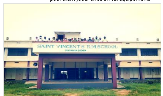
Administrateurs, enseignants et personnel non enseignant de l'école avec le bâtiment achevé, 2020.

Vincentian Solidarity Office | 500 East Chelton Avenue | Philadelphia, Pennsylvania 19144 | USA Telephone: +1 215-713-3998