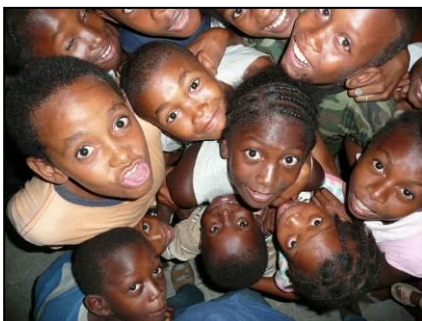
Niños Garifuna de la Misión de Honduras

juventud - como las Juventudes Marianas Vicencianas - e implica colaboración con otras organizaciones dentro de la familia Vicenciana. Durante los seis últimos años nuestros misioneros