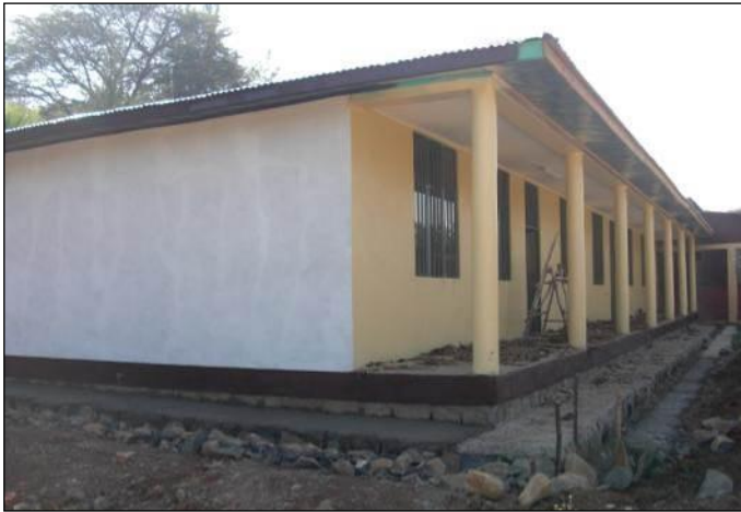
La nueva clase en la escuela Santos Pedro y Pablo

La Escuela católica Santos Pedro y Pablo en Jimma, al oeste de Etiopía, es propiedad del Vicariato Apostólico de Jimma Bonga y está administrada por nuestra Provincia Etiópica. Desde su establecimiento, en 1984, como una escuela primaria inferior, la escuela ha crecido constantemente y se ha expandido hasta incluir todos los grados primarios y secundarios. La escuela sirve mayormente a familias de personas marginadas en Jimma que sobreviven con negocios insignificantes y trabajo.