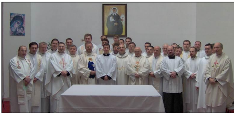
Misioneros de la Provincia de Eslovaquia

juventud - como las Juventudes Marianas Vicencianas - e implica colaboración con otras organizaciones dentro de la familia Vicenciana. Durante los seis últimos años nuestros misioneros