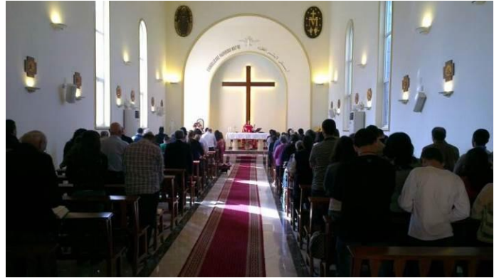
Liturgia en la capilla recientemente renovada

La capilla de la casa fue destruido por un incendio en 1975 y fue remendada en 1981, para continuar con su misión de evangelización. Desafortunadamente, La capilla fue mal reparado por lo que necesitaba algunas modificaciones sustanciales. La Provincia de Oriente buscó la ayuda de la OSV en este esfuerzo. La OSV obtuvo una donación de Iglesia en Necesidad, que combinó con dineros de la Obra de Oriente y de la FSV, para financiar mejoras claves en la capilla, tales como escayolado, pintura, losado, agua, y trabajo eléctrico.