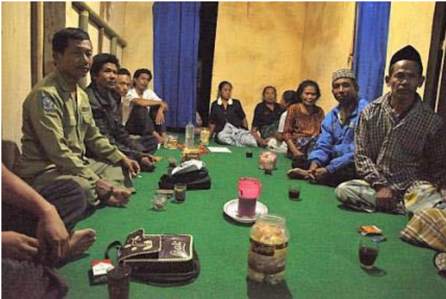
Obreros de granja reunidos para el entrenamiento y la organización

Los obreros de granja en muchas zonas de Indonesia sufren bajos salarios, pobres condiciones de vida, falta de escuelas para sus niños, y derechos limitados para reunirse y hablar. Nuestros misioneros de Indonesia han trabajado para entrenar y organizar a los obreros de granja, al este de la Provincia de Java, durante algún tiempo, teniendo como objetivo plantaciones grandes e injustas. Los misioneros enseñan sus derechos de acuerdo con la ley de Indonesia a los trabajadores que luchan, y desarrollan grupos cohesivos y líderes para asesorar sobre mejores condiciones de trabajo y justas compensaciones.