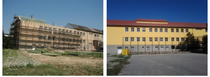
San László durante y después de las renovaciones

tiempo. Resultaba también pequeño para acoger la creciente matriculación.