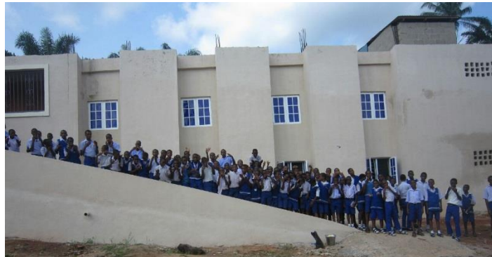
El nuevo albergue escolar inclusivo y sus estudiantes

Muchos de los niños de las escuelas de San José y De Paul viven lejos y necesitan poder hospedarse en las escuelas. Nuestros misioneros en Oraifite decidieron integrar aún más a los niños sordos o que tienen problemas para escuchar con los que no las tienen en la escuela, invitándoles a vivir juntos; por lo que necesitan construir un nuevo albergue para poder realizar ésto.