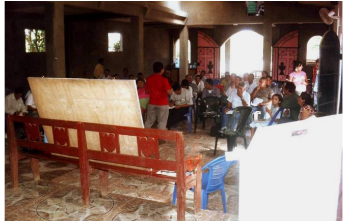
Taller en la parroquia de San Antonio de Padua

en El Salvador: La parroquia de San Antonio de Padua en Nueva Concepción, Chalatenango. La Parroquia comprende 29 comunidades dispersas. Muchas de las comunidades han carecido de servicios religiosos durante años. Muchas sufren una gran pobreza y problemas sociales. Los misioneros que trabajan en las parroquias vieron la urgencia de formar agentes pastorales que sirvan a esas comunidades. A través de su Provincia consiguieron la concesión de un Micro-Proyecto VSF de la VSO para comprar un equipo de ordenadores, ayuda clerical, material docente y sillas para talleres para formar a 75 agentes de pastoral en la parroquia.