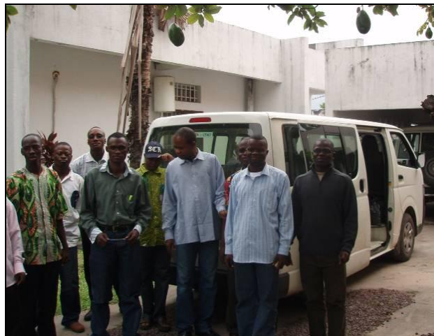
Seminaristas con su nuevo minibús en Kimwenza

provincia. Los estudiantes viajan distancias largas para ir a los Institutos donde reciben la formación.