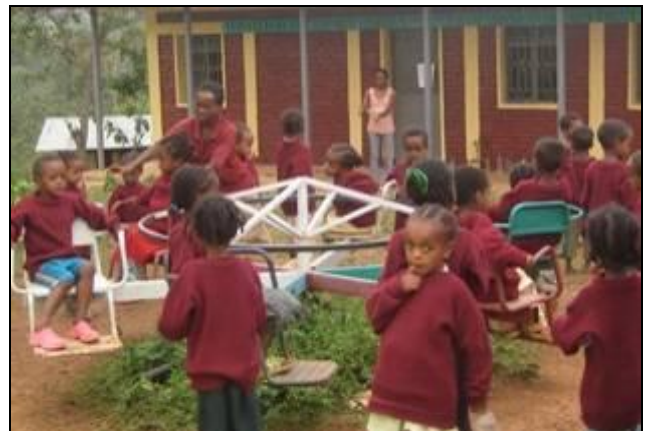
Niños jugando en el tiovivo en Shera Qeja