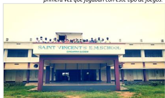
Administradores, maestros y personal no docente de la escuela con el edificio terminado, 2020.

Vincentian Solidarity Office | 500 East Cheltenham Avenue | Philadelphia, Pennsylvania 19144 | USA Telephone: +1 215-713-3998