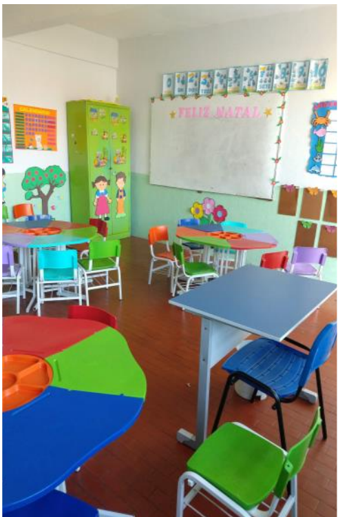
El aula preescolar

Los estudiantes de la Escuela Colegio Maria Montfort siempre han disfrutado del aprendizaje, pero no de los escritorios. Durante años los estudiantes estuvieron sentados en los mismos escritorios incómodos en la Escuela Colegio María Montfort en la ciudad de Fortaleza, capital del estado de Ceará, Brasil. La VSO recientemente encontró comentarios de un revisor en línea, quejándose de que los escritorios y sillas estaban en un terrible estado de deterioro y se había convertido en una gran distracción para el aprendizaje. ¡Nuevos escritorios eran urgentes! La escuela atiende a unos 300 niños y adolescentes desde el jardín de infantes hasta la escuela media de los barrios de ingresos más bajos de Fortaleza, Brasil y con una variedad de grupos étnicos. La Provincia de Fortaleza solicitó ayuda y la VSO otorgó una subvención para reemplazar los escritorios obsoletos. Las líneas