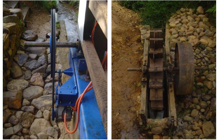
Anciens et nouveaux composants de la génératrice

travaux d'implantation du projet. Ce projet, qui est maintenant terminé, a vraiment transformé leur vie.