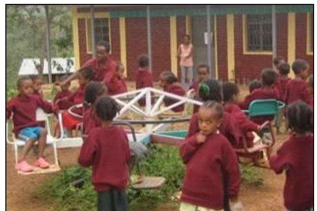
Des enfants jouent sur le manège à Shera Qeja