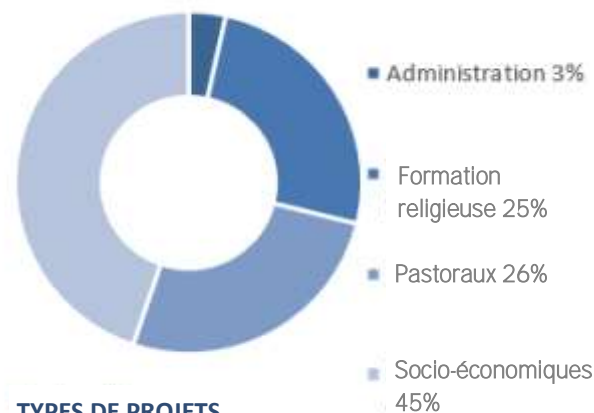
TYPES DE PROJETS

Projets socio-économiques : projets soutenant les besoins matériels et le développement des personnes et des communautés Montant dépensé : 423 134 $