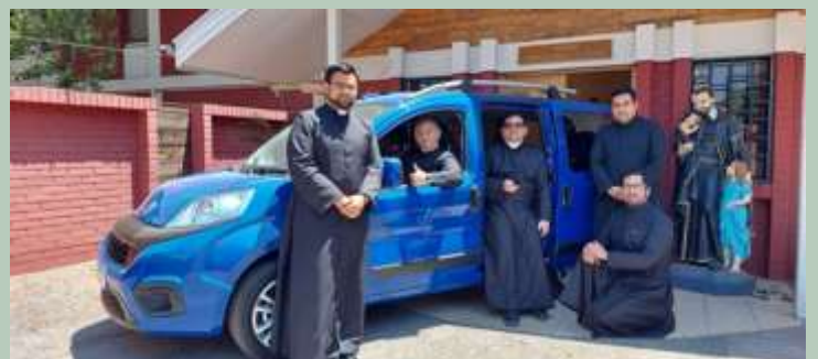
Chili : Achat d'un véhicule pour la Pastorale de la Caridad Seminario San Vicente de Paul, Santiago