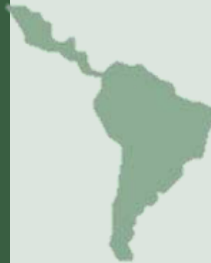
Cuba : Stockage d'eau et amélioration de la cuisine pour les familles pauvres, La Habana, Barrio El Cerro