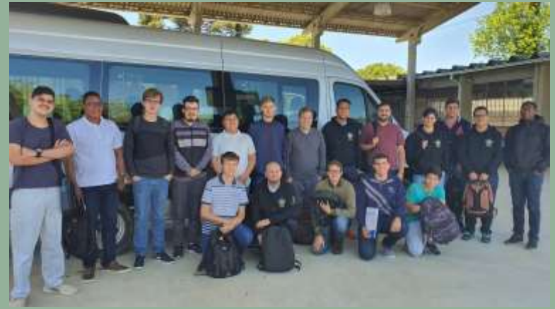
Brésil : Achat d'une Mercedes-Benz Sprinter Châssis 515 pour le Séminaire Notre-Dame de Grâce, Curitiba