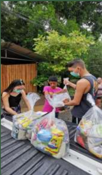
Costa Rica : Programme de formation pour les laïcs, distribution de nourriture aux internes de la Parroquia de San Judas Tadeo, pendant la pandémie de COVID-19