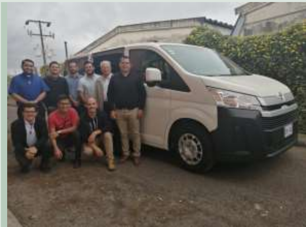
Costa Rica : Nouveau mini-bus Toyota pour le transport des Séminaristes de la Casa de Formación, San José