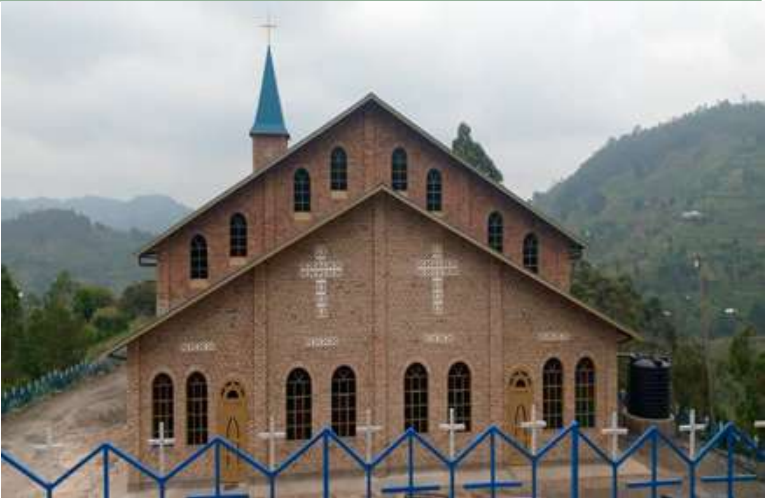
Sur la photo : Église nouvellement construite de la paroisse de Kanaba, Rwanda. Le VSO a aidé à meubler le presbytère de cette paroisse, certains des nouveaux meubles sont illustrés ci-dessus.

Vincentian Solidarity Office 500 East Chelton Ave., Philadelphia, PA 19144 U.S.A. Phone: 215-713-2432 Email: cmvso@yahoo.com Website: www.cmglobal.org/vso A 501 (c) (3) organization in the U.S.