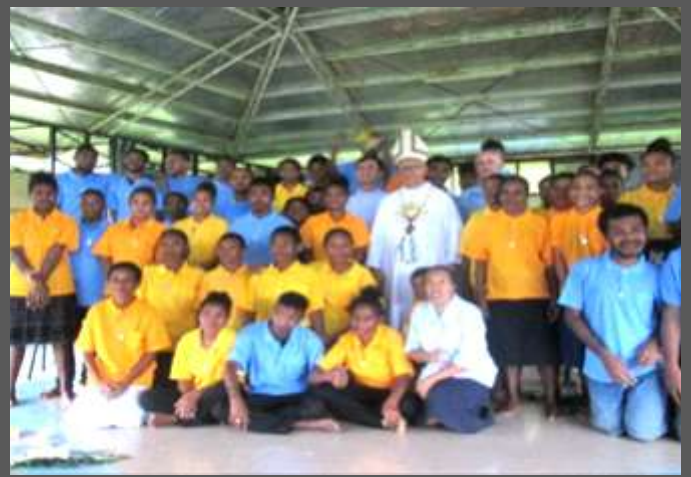
Papouasie-Nouvelle-Guinée: Formation de missionnaires laïcs pour des projets pastoraux