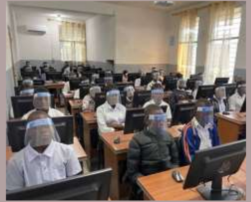
République Démocratique du Congo: Laboratoire informatique pour le complexe scolaire Saint Vincent DePaul à Kinshasa