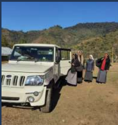
Inde: Jeep pour la station missionnaire de Wakka en Arunachal Pradesh, diocèse de Miao