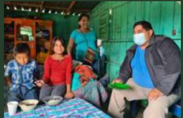
Amérique Centrale: Aide alimentaire pour les familles touchées par le COVID 19