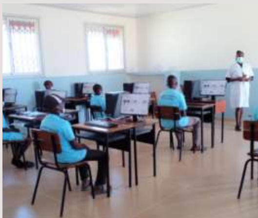
Mozambique: Laboratoire informatique pour l'école secondaire du village de Chinhacanine