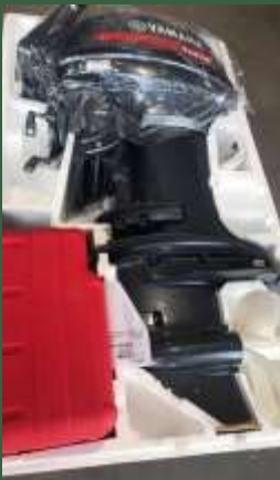
Honduras: Achat d'un moteur de 40 chevaux pour les visites pastorales dans les 32 communautés de la paroisse de Santa Cruz