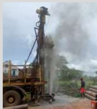
Sierra Leone: Forage d'eau pour un complexe scolaire

–et de nombreux contributeurs individuels, confrères, familles et amis de nos missionnaires vincentiens.