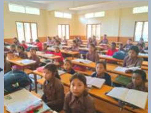
Inde: Fourniture de meubles pour le foyer des filles à Klurdung, Assam