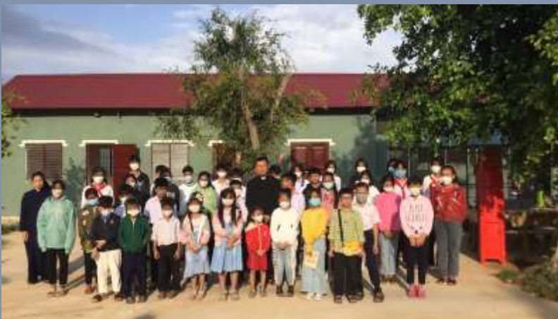
Vietnam: Construction d'une maison pastorale pour les cours de catéchisme, la chorale et d'autres activités communautaires