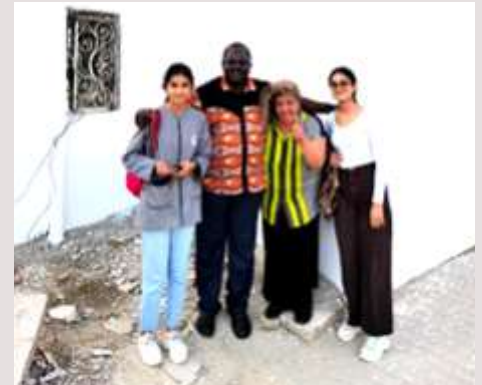
Tunisie: Réparation de maisons pour des voisins âgés