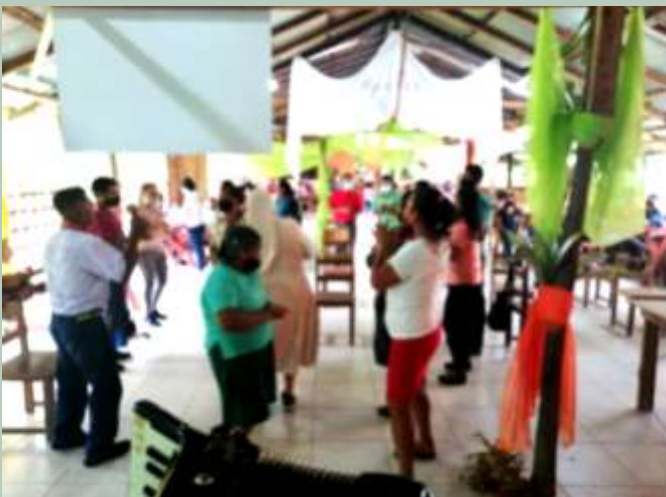
Costa Rica: Rénovation de la salle paroissiale et du foyer