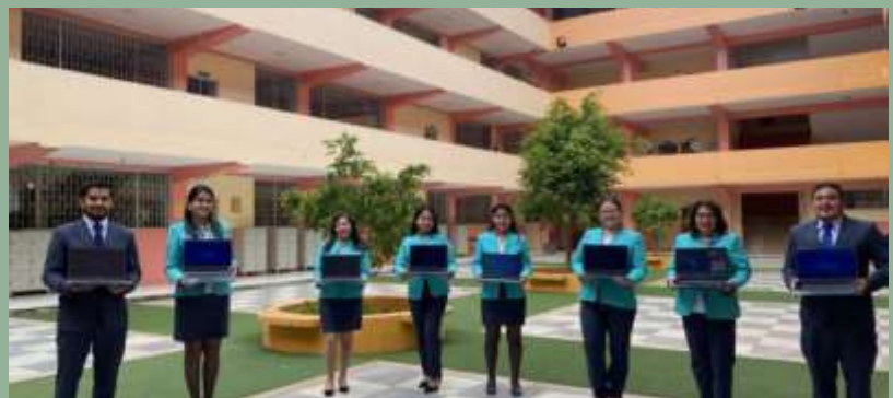
Equateur: Ordinateurs pour les enseignants du collège St. Vincent de Paul