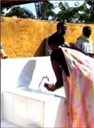
Rwanda: Installation d'équipements sanitaires incluant des stations de lavage des mains pour la lutte contre le COVID19 pour l'église du Camp de Réfugiés de Mahama