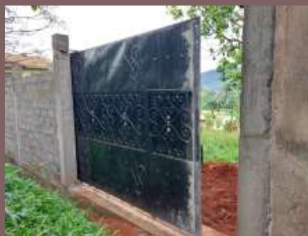
Cameroun: Construction d'un mur d'enceinte pour le Grand Séminaire St. Vincent DePaul de Yaoundé