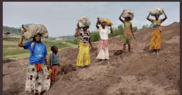
Rwanda: Extension de la plantation de café de la paroisse de Gitare