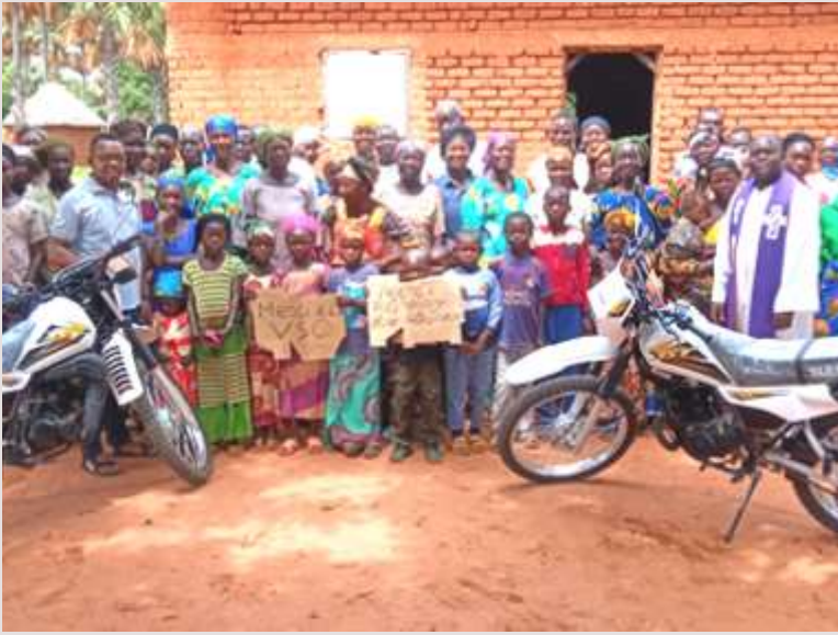
Tchad: Achat de trois motos pour la mission paroissiale de Bebalem