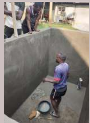
Cameroun: Construction d'une ferme piscicole pour la sécurité alimentaire