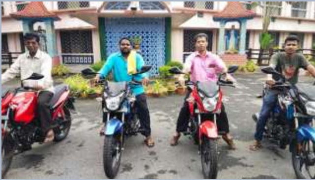
Inde: Quatre motos pour les œuvres socio-pastorales des Missions Vincentiennes de Jubaguda, Kottogodo, Dukuma et Padangi

Voici quelques-uns des projets rendus possibles grâce à l'aide de nos collaborateurs et donateurs tout au long de l'année 2021. Pour encore plus d'informations sur les projets, veuillez consulter notre site web: www.cmglobal.org/vso-fr