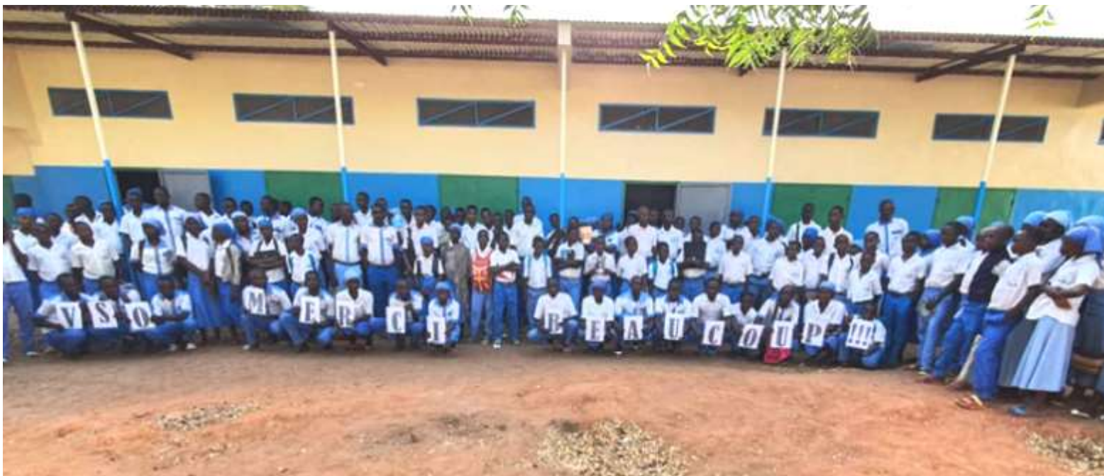
Tchad: Construction d'une salle polyvalente pour le Lycée Collège St. Jean-Baptiste de Bebaem

Vincenian Solidarity Office 500 East Chelton Ave., Philadelphia, PA 19144 U.S.A. Phone: 215-713-3998 Email: VSO1@cmphlsvs.org Website: www.cmglobal.org/vso A 501 (c) (3) organization in the U.S.