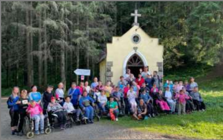
Ukraine (avant-guerre): Retraite pour les résidents handicapés de l'orphelinat et du personnel de Zaluchansk