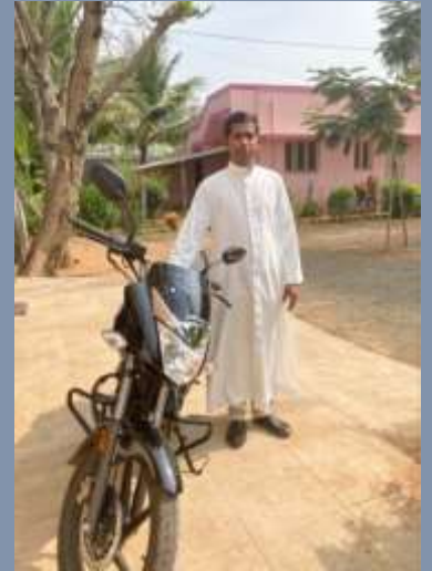
Inde: Trois motos pour le séminaire DePaul, l'église St. Joseph et le service social Sountham