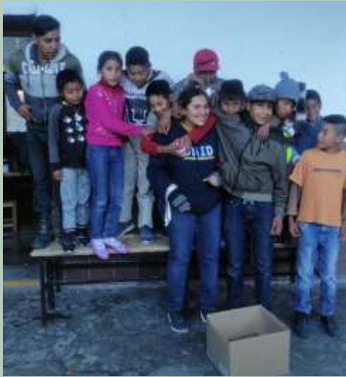
Mexique: Rénovation d'un foyer pour garçons et d'un dispensaire pour les enfants indigènes de la mission Sierra Tarahúmara, Chihuahua