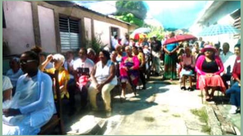
Cuba: Maison pastorale avec programme alimentaire pour la population âgée locale