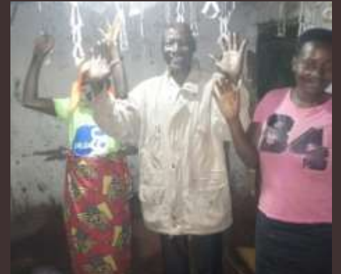
Burundi: Electrification du complexe paroissial, du presbytère et de 60 maisons locales à Rwisabi et Kidasha